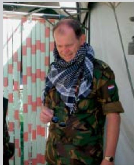
Generaal-majoor Dedden uitgerust met Afghaanse shawl

Personeel van de Militaire Inlichtingen- en Veiligheidsdienst (MIVD) nam deel aan de ISAF-missie (International Stabilisation and Assistance Force). Omdat de missie tot 12 augustus jongstleden onder Duits-Nederlands commando heeft gestaan, was er behoefte aan extra inlichtingen capaciteit. De MIVD leverde vanaf januari 2002 personeel voor de Nationale Inlichtingen Cel (NIC), het contra-inlichtingendetachment en het verbindingsinlichtingen-detachment.●