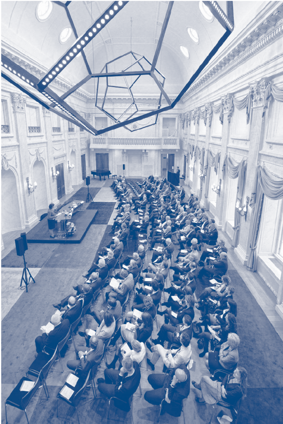
Symposium van 18 april 2012.