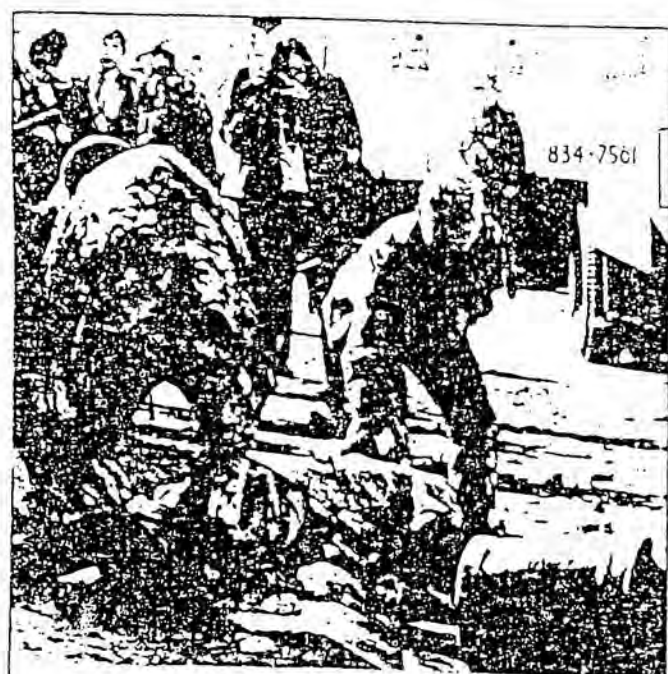
Soweto 1976: De politie in actie

Biko en de Zwarte Bewustzijnsbeweging worden nogal eens afgeschilderd als zwarte racisten. Biko zei dat het de onderdrukte zwarten aan politieke en economische macht ontbreekt om een andere groep te discrimineren. De Zwarte Bewustzijnsbeweging is niet racisties "want wij willen juist ongelijkheden en conflicten als deze uitwissen in onze maatschappij en een open en egalitaire maatschappij opbouwen. Vrij van uitbuiting van de ene mens door de andere, een maatschappij die menselijke belangen en waardigheid boven de belangen stelt die door winstmaken zijn geïnspireerd".