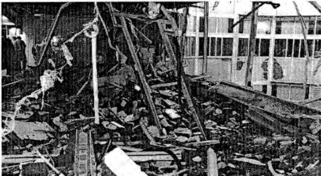
De ravage bij de DIA

Later op de ochtend, rond vijf uur, kwam over de fax van Radio Rijnmond een vier vellen tellende verklaring binnen, waarin de aanslag werd opgeëist door de Revolutionair Anti Racistische Actie (RARA) 50 . In de verklaring stelt RARA het te hebben gemunt op de Dienst Inspectie Arbeidsverhoudingen (DIA) van het departement, omdat die afdeling een spilfunctie vervult in de jacht op illegalen.