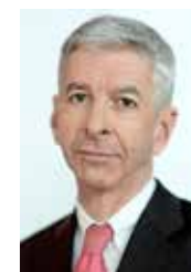
dr. Ronald Plasterk Minister van Binnenlandse Zaken en Koninkrijksrelaties

In de anderhalf jaar dat ik de AIVD nu politiek aanstuur ben ik zeer onder de indruk geraakt van het niveau van werken, de inzet, betrokkenheid en professionaliteit van de medewerkers. Waar anderen regelmatig bevestiging kunnen krijgen over hun werk, via publiciteit, van de kant van bezoekers, ja zelfs van vrienden en bekenden, werken de AIVD-medewerkers volledig buiten het zicht. Ze kunnen zelfs thuis maar in beperkte mate vertellen over hun werk. Ook kan zelden publiek worden gemaakt wat de resultaten zijn van hun werk en welke risico's voor de samenleving zijn afgewend. Dus op deze plaats grote dank aan en groot respect voor de AIVD-mensen. Zonder hun enorme inzet zouden het land en de wereld een stuk minder veilig zijn.